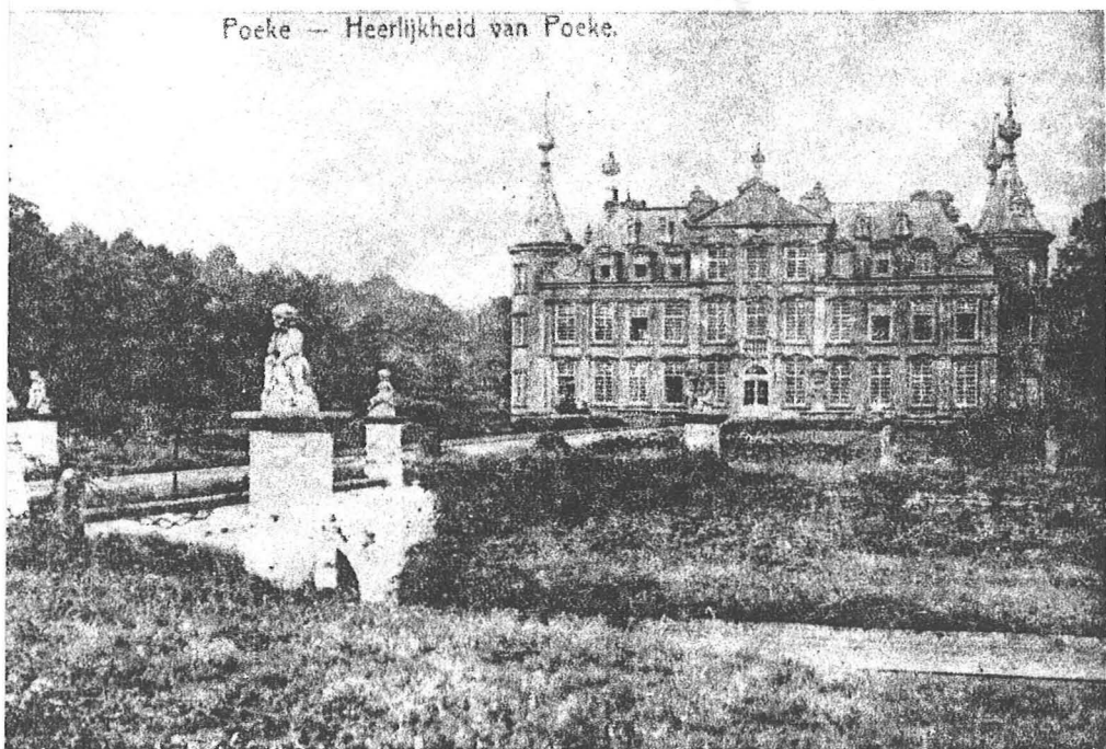
Poeke — Heerlijkheid van Poeke.